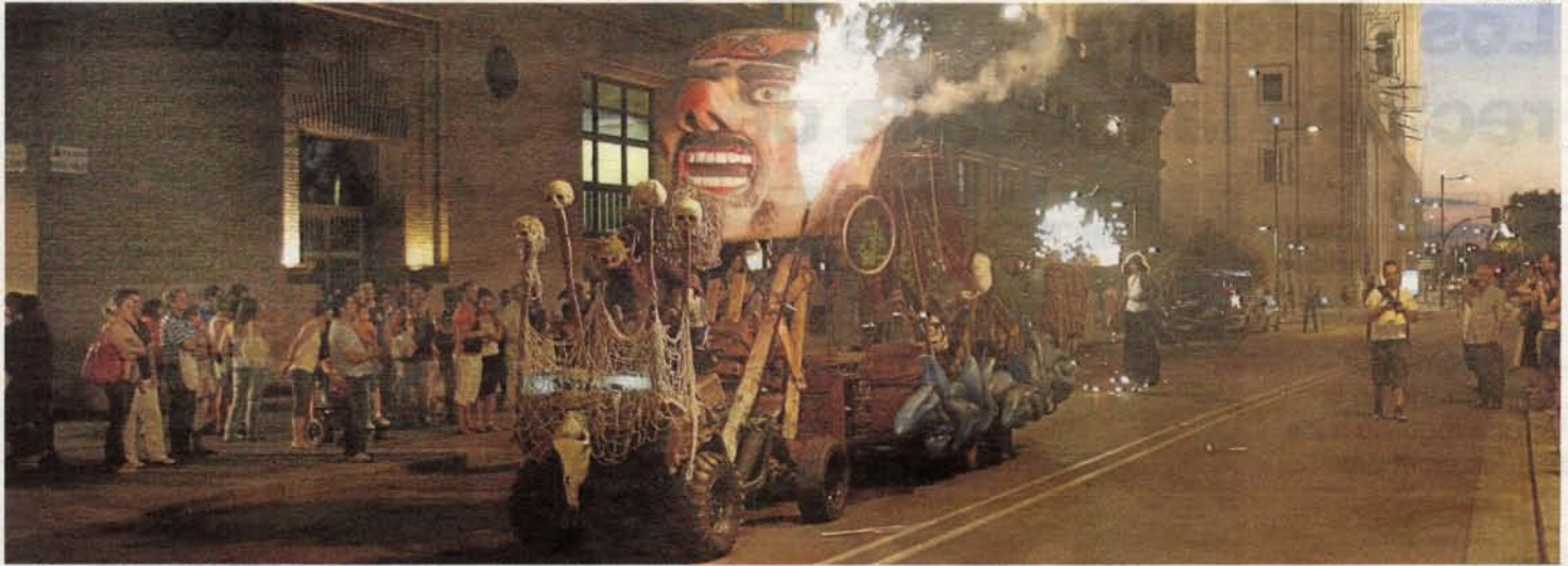
►► El pasacalles de los Piratas de Isla Malpica fue un logrado espectáculo de fuego, música y ruido que discurrió entre San Juan de los Panetes y el puente de Piedra.