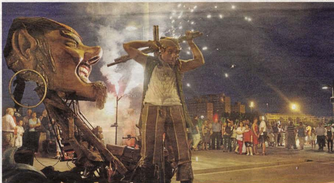
El espectáculo celebrado con motivo de la inauguración de los Festivales del Ebro congregó a cientos de personas.

|| El déficit público crecerá y obligará en el 2010 a un fuerte incremento de la presión fiscal