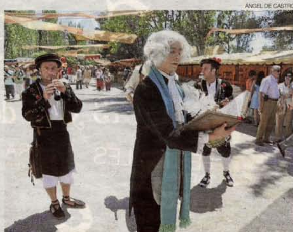
►► El mercado goyesco, ayer, en la Arboleda de Macanaz.