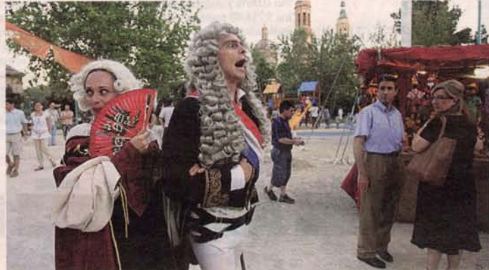
La pareja nobiliaria francesa da vivas a su ejército en el mercado goyesco. J. CARLOS ARCOS