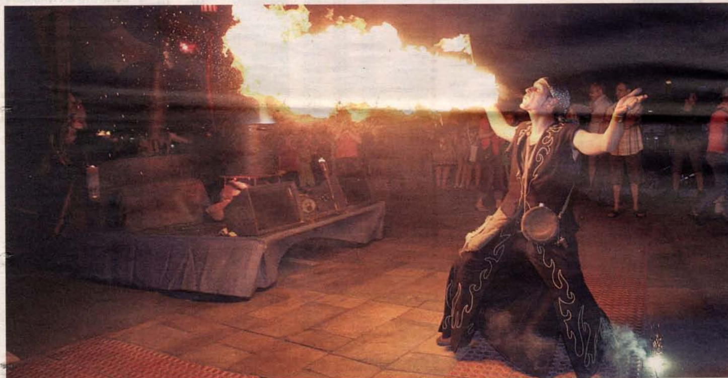
Un tragafuegos lanza una llamarada junto a sus compañeros de pasacalles, anoche, en el paseo Echegaray y Caballero. JUAN C. ARCOS

El Mercado Goyesco de Macanaz y los pasacalles animaron la caída de la tarde