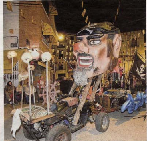
Los Piratas de Isla Malpica tomarán el Puente de Piedra.

Y en el Parque de Macanaz, desde hoy a las 12.30 horas, se inaugura el Mercado Goyesco, con un pregón que pondrá fin a los actos del Bicentenario de los Sitios y que durante todo el fin de semana trasladará al público a los primeros años del siglo XIX. ■