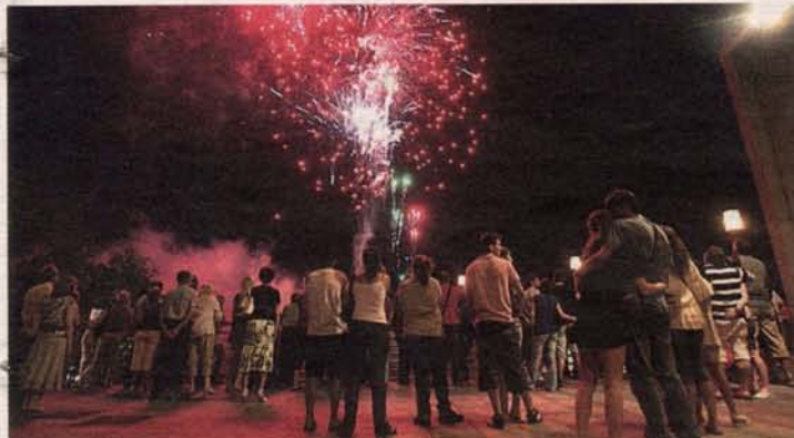
Los fuegos artificiales, como siempre, encandilaron al personal. JUAN CARLOS ARCOS