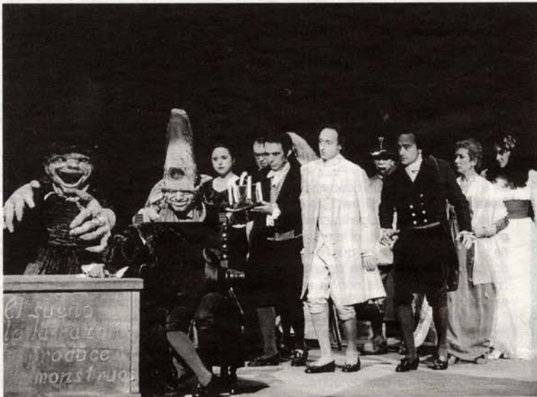
Escenificación de El Sueño de la Razón.