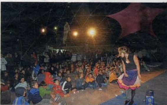
►► Circo Badín trabaja en Foz de Calanda.

gación de estrenar una obra cada año en el Festival Nocte, que se celebra en la localidad. Además, cada mes, la compañía realiza una muestra en la que expone lo realizado.