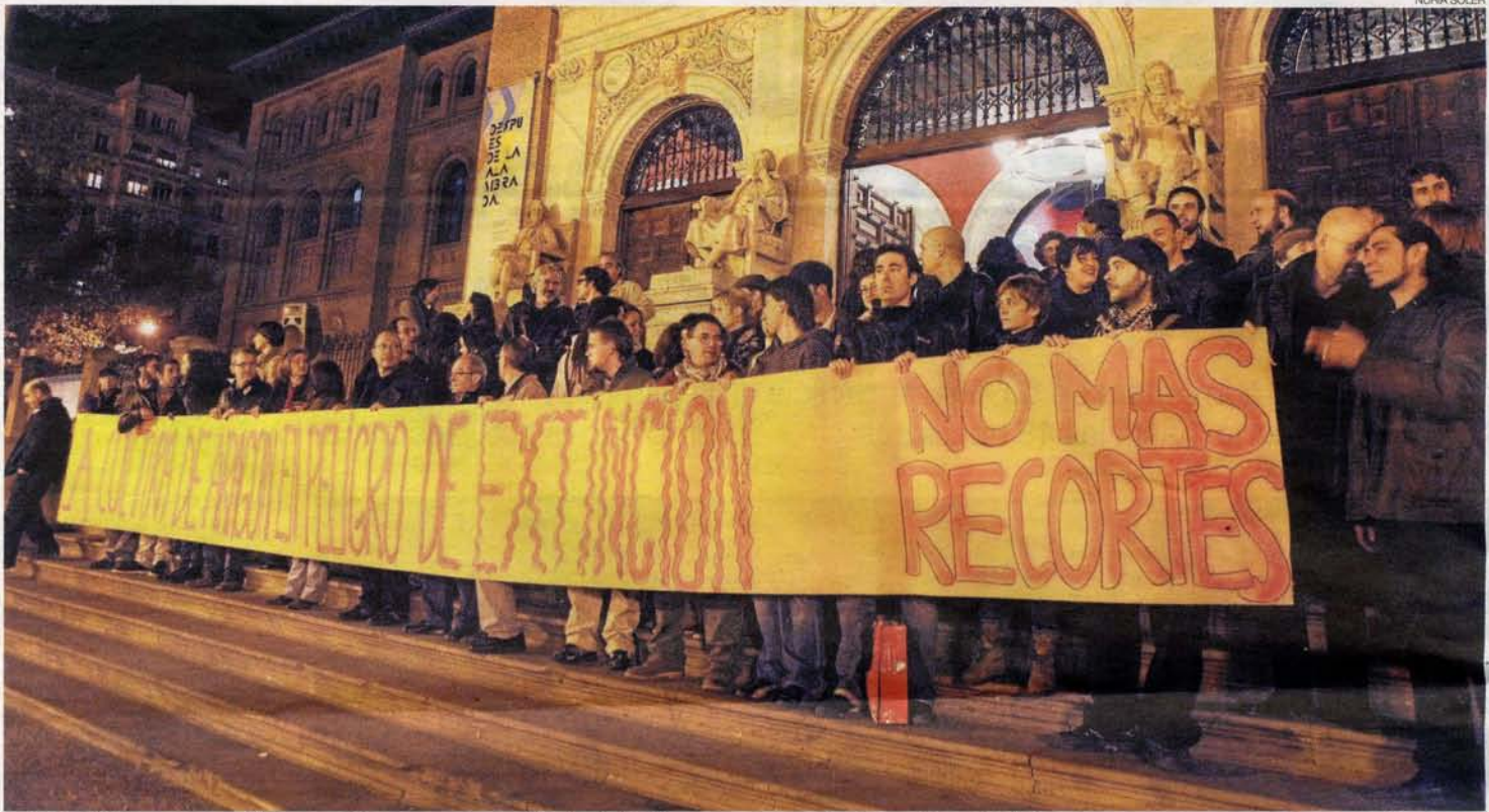
► Los artistas aragoneses exigieron ayer más presupuesto para el sector de la cultura con una concentración en el Paraninfo de Zaragoza.