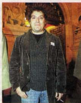
JORGE ASÍN Actor

«El gobierno no se puede escudar en la crisis para cargarse el trabajo de la gente. Un recorte tan tremendo es no entender el sentido de la cultura y va a tener consecuencias. Se acabarán los grupos de artistas de Aragón».