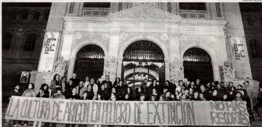
►► Protesta de los artistas por los recortes en Cultura, el pasado día 12.

Su desprecio es manifiesto, además de insultante, cuando sin ningún pudor afirma que no ha habido movimiento ciudadano desde los años 70 capaz de hacer propuestas culturales serias. Este pensamiento causa en nosotros estupor, espanto y vergüenza por muchos motivos. El primero, porque es falso que no haya propuestas por parte