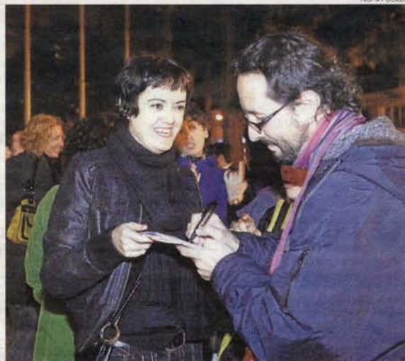
► Los zaragozanos firmaron el manifiesto.

ADHESIONES CIUDADANAS / Si eran cerca de ochenta personas las que se situaron durante la concentración (que duró alrededor de una hora) detrás de la pancarta, fueron muchos los ciudadanos que, extrañados, preguntaron por qué protestaban los allí reunidos. La respuesta que recibieron fue el manifiesto Malos tiempos para la lírica , al que invitaban a adherirse. Buena parte de los ciudadanos se solidarizaron